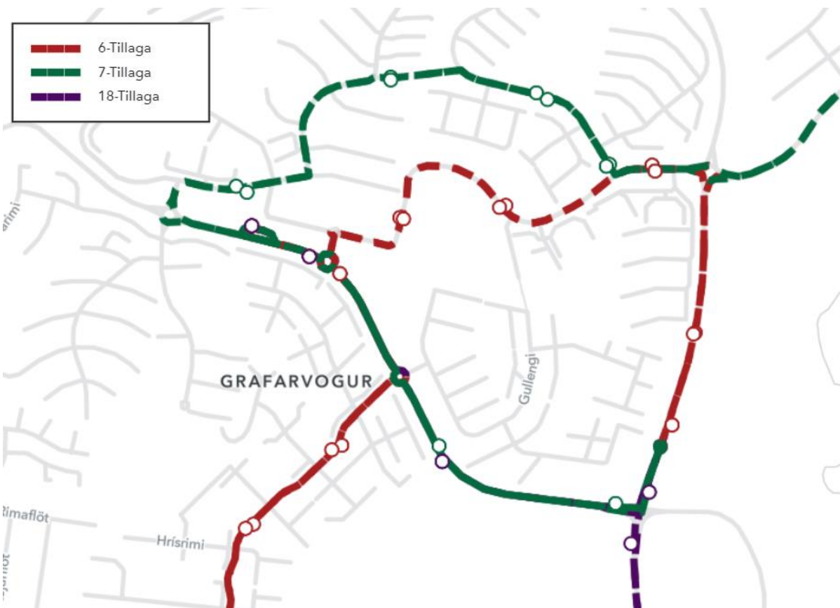
Mynd 1 Efri myndin sýnir núverandi leiðakerfi. Neðri myndin sýnir tillögu að breytingum. Erfitt er að sjá að á efri myndinni (núverandi leiðanet) ekur leið 18 áfram norður eftir Víkurvegi og beygir inn Mosaveg. Á neðri myndinni (tillaga) beygir leið 18 inn Borgarveg eftir viðkomu við Egilshöll og endar í Spöng.